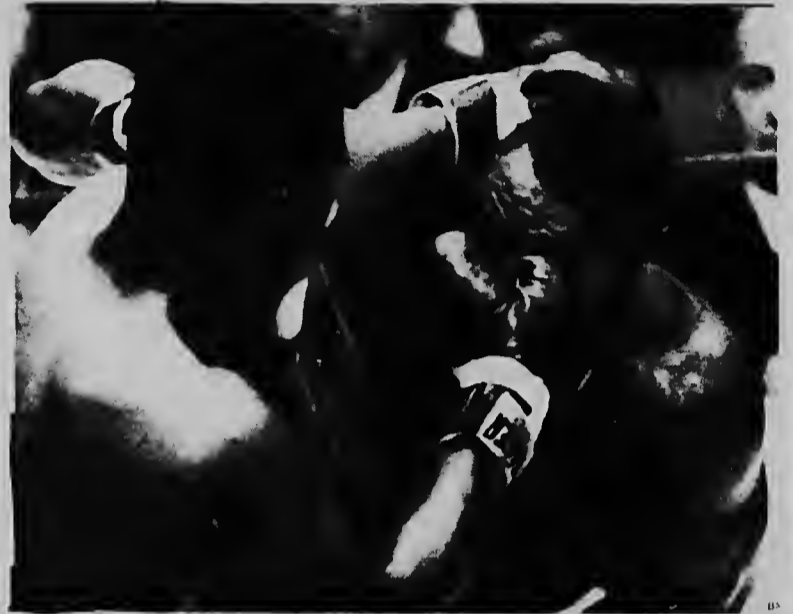
Di serca Clay ta castiga e cara di Liston.

E pelea mas grandi di e anja aki pa e titulo mundial di peso completo entre Sonny Liston y Cassius Clay a termina cu un victoria di sorpresa di Clay riba su adversario cu tabata favorito den e pelea aki. E pelea a dura seis round, den di shete Liston no por a sali den ring mas pa motibu di un knockout tecnico. Riba e pagina aki, algun bista di e pelea grandi aki.